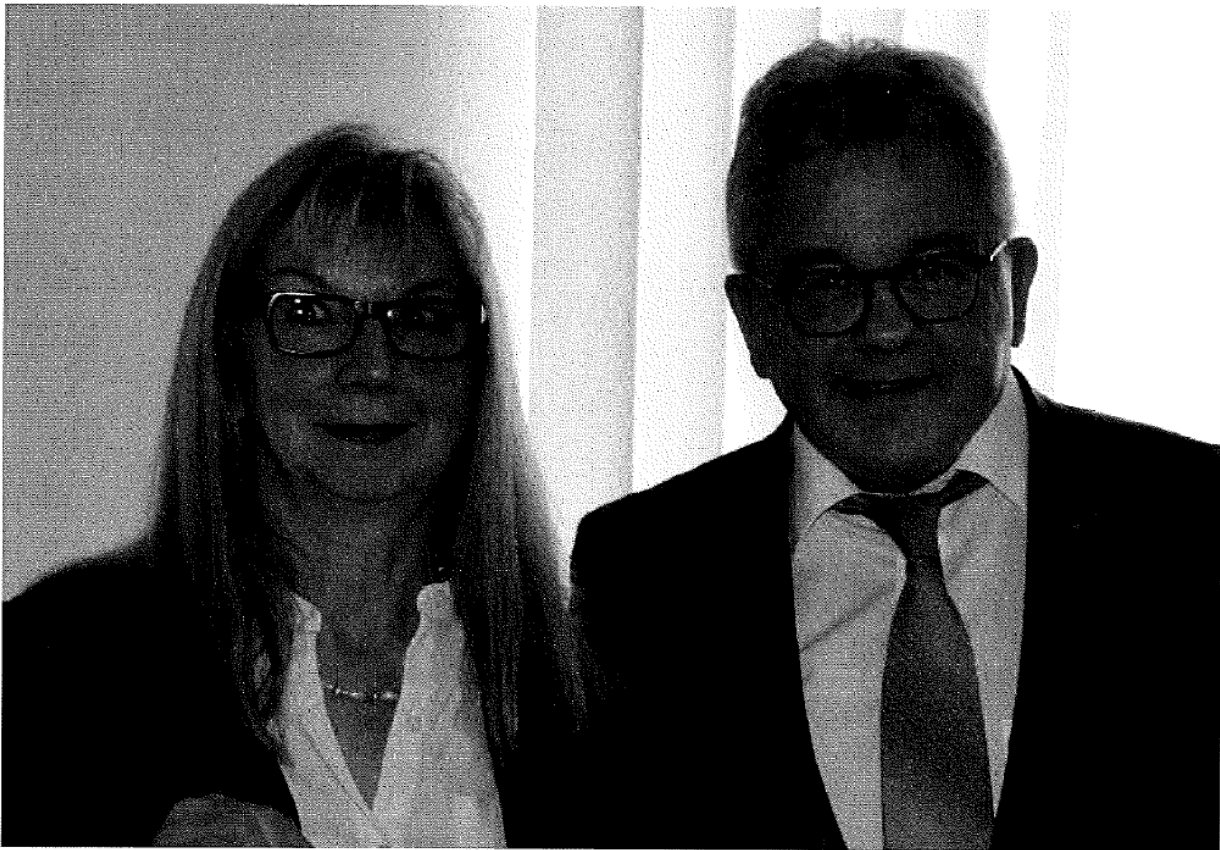
Guido Wolf MdL, Minister der Justiz und für Europa und CDU-Landtagsabgeordneter des Wahlkreises Tuttlingen-Donaueschingen mit Margarete Lehmann, Vorsitzende des Sportkreises Tuttlingen

Die hilfsbedürftigen Bürgerinnen und Bürger können sich schließlich im Abgeordnetenbüro von Guido Wolf MdL telefonisch unter 07461/9654771 oder per E-Mail an info@guidowolf.info melden und mitteilen, welche Art von Botengang dringend erledigt werden müsste. Etwaige Einkaufszettel oder Rezepte werden anschließend von den Unterstützerinnen und Unterstützern von „TEAMEinkauf“ abgeholt und die Besorgungen erledigt.