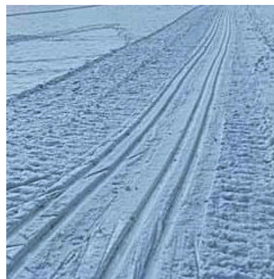
eine frisch angelegte, intakte Loipenspur

Leider wurde diese Einrichtung die letzten Tage nicht wirklich wertgeschätzt und wurde wieder mehrfach von Wanderern, Spaziergängern, vor allem auch Hunden und/oder auch Schlittenfahrer/innen schwer in Mitleidenschaft gezogen. Schade... denn ein Marschieren auf dem parallellaufenden Weg wäre eigentlich viel angenehmer.